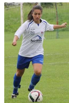
SHEILA (FFC Vorderland – AUT)

25/03, At. Granadilla-Collerense (3-2). Volveu disputar o partido completo no encontro adiantado que permitiu ao cadro tinerfeño atoparse de novo coa vitoria.