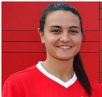
PATRI (C. At. Madrid B)

20/03, Santa Teresa-Oiartzun (1-1). Estivo entre as convocadas, pero o seu técnico non a utilizou no partido.