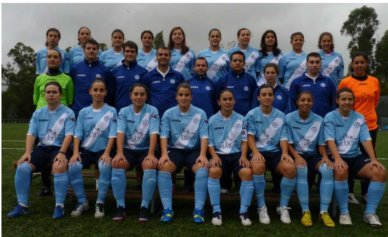
Bértola.