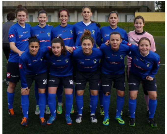
El Olivo que caeu contra o Victoria.