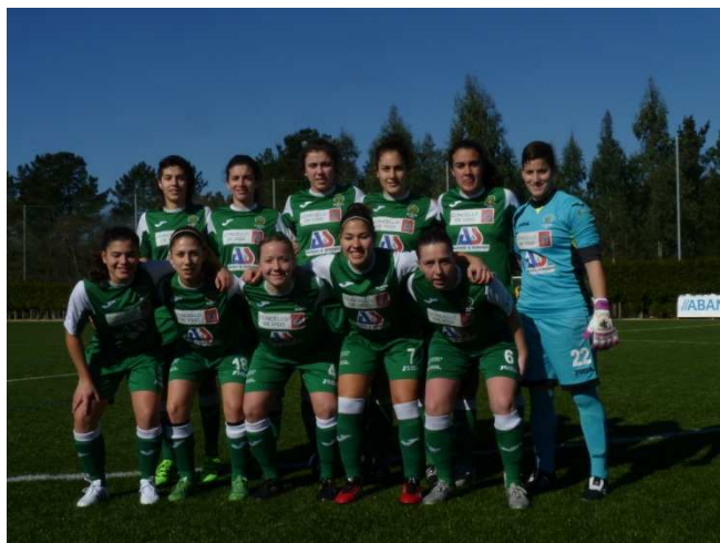
El Olivo.