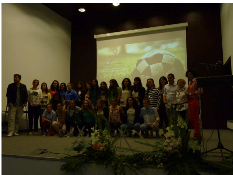
As mellores do fútbol galego na Gala de Tomiño.