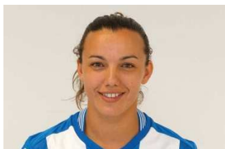
ANAÍR (R.C.D. Espanyol)

19/03, Espanyol-At. Madrid (1-2). Regresou da lesión e xogou o partido completo contra un dos aspirantes ao título.