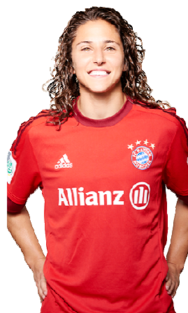
VERO (FC Bayern - DEU)

Facendo a pretemporada invernal co seu equipo en Turquía.